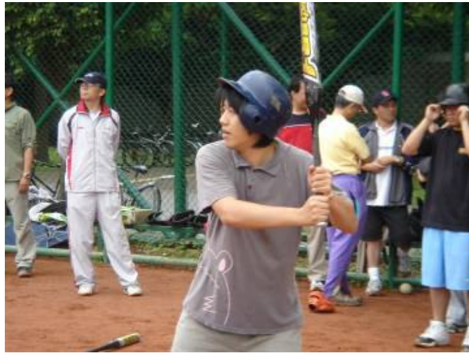
農化系師生壘球對抗賽比賽現場