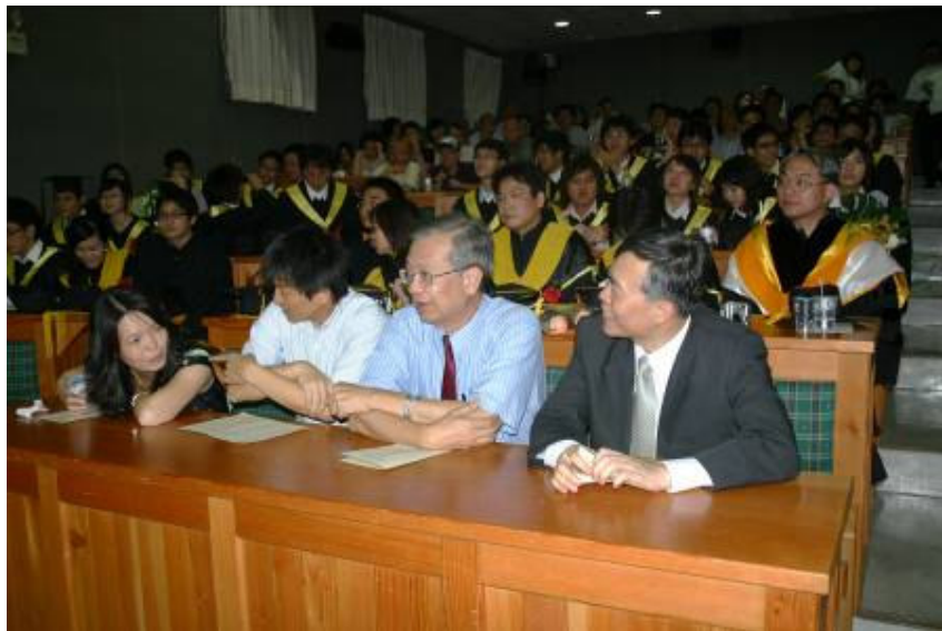
2008 年農化系畢業生撥穗典禮盛況

2008 年農化系畢業生撥穗典禮，於 6 月 7 日(星期六)下午一時假臺大物理系凝態中心會議廳 104 室舉行，除了有應屆畢業生及教師參加外，並邀請家長共襄盛舉。