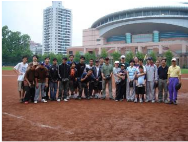
農化系師生壘球對抗賽大賽參加人員