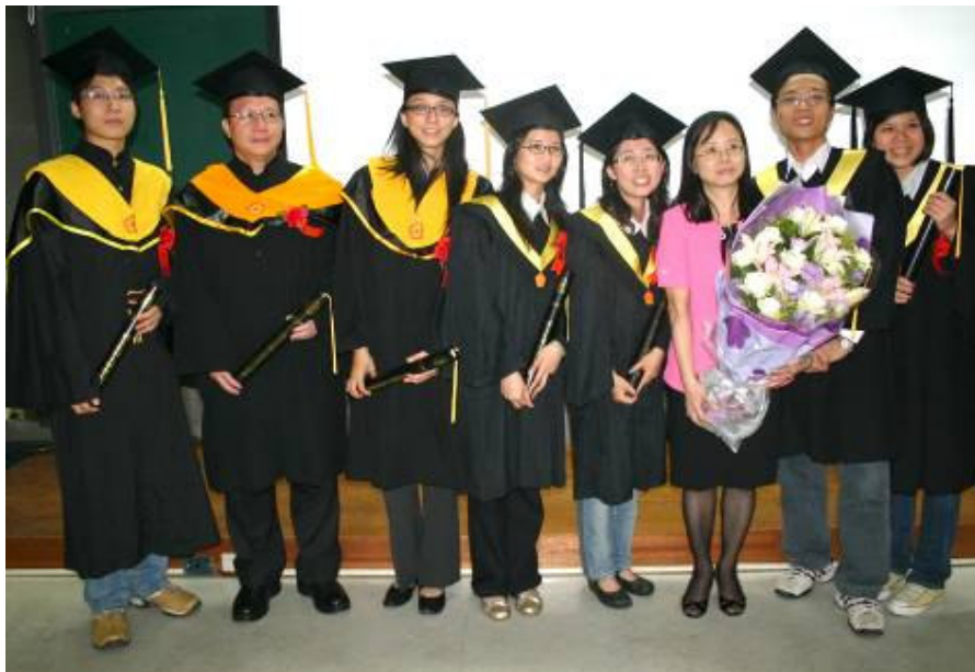
畢業生撥穗後一同與指導教授合照