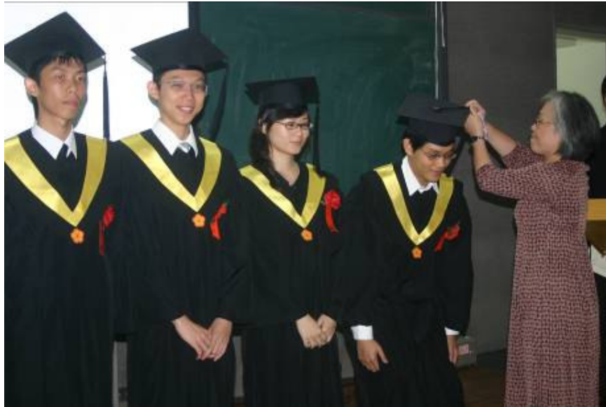
畢業生上台後由指導教授為其撥穗