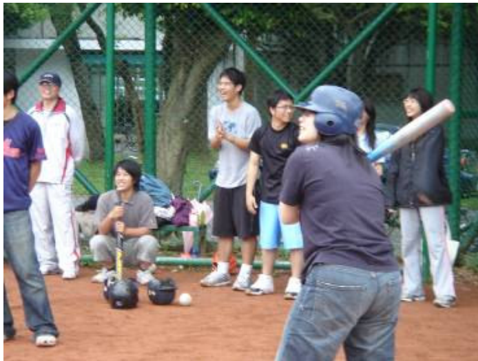
農化系師生壘球對抗賽比賽出現左手打擊者